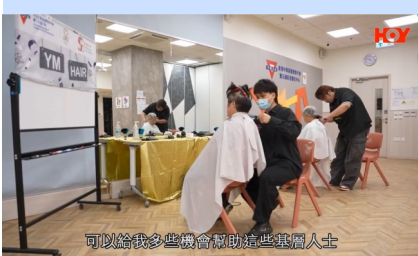
可以給我更多機會幫助這些基層人士